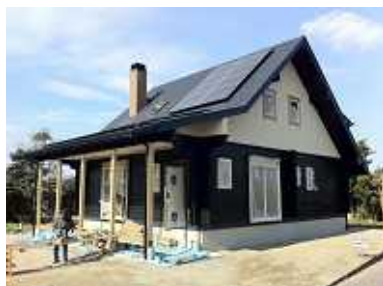
南さつま市加世田 マシンカットログ(角型スギ)