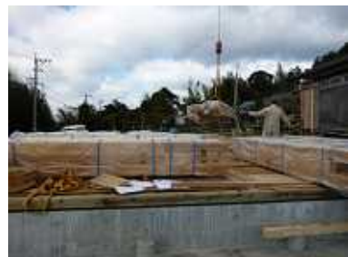
伊佐市菱刈 マシンカットログ(D型スギ)

日置市日吉町 ハンドカットログハウス 南さつま市加世田 マシンカットログ(角型スギ) 伊佐市菱刈 マシンカットログ(D型スギ)