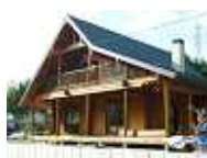
伊佐市菱刈マシナカットログ (D型スギ)

日置市日吉町 ハンドカットログハウス 伊佐市菱刈 マシナカットログ(D型スギ) 鹿屋市野里町 ウッドフレーム