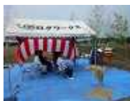
鹿屋市野里町 ウッドフレーム